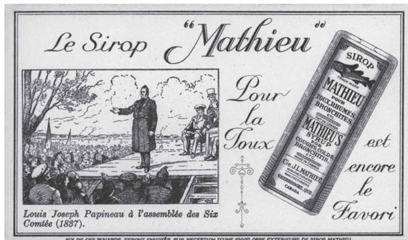
Un exemple de document éphémère : une publicité pour le sirop « Mathieu » contre la toux (M2002.70.D05/149-02)

Le même auteur remarque toutefois que cette tendance est peu répandue dans les grands centres d'archives, et qu'elle se limite plutôt à de petits organismes souvent près des milieux communautaires ou sociaux (bien qu'il note qu'on retrouve de grandes quantités d'éphémères dans les centres majeurs comme les ANC, mais que leur acquisition et leur description ne s'y fait pas de façon systématique). À ce titre, nous avons déjà noté que le McCord a déjà dans ses réserves plusieurs collections de ce type de documents, l'acquisition de plaquettes, de livres de cuisine ou de prospectus étant des exemples récents d'intégration de matériel éphémère à la collection du Musée. Les collections d'invitations, de prospectus, de menus ou de valentins sont tous d'autres exemples qui démontrent que ces documents ont leur place au sein d'une institution vouée à l'histoire, et qu'étant souvent dépourvus de liens directs entre eux, ces documents pourraient sans doute être qualifiés « d'instruments voués à la bonne conduite des affaires et des relations », et donc d'objets de culture matérielle » à part entière.