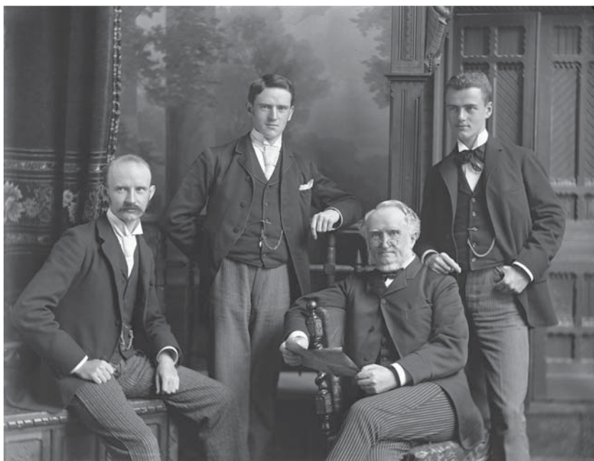
William Notman et ses fils en 1890 (II-102010)

L'acquisition d'archives au McCord s'est donc poursuivie dans le respect des bases jetées par son fondateur, et le « mandat archivistique » s'est certes raffiné en tenant compte des courants historiographiques et historiques contemporains, mais aussi en intégrant une grande variété de documents de toute nature et de tout format. La caricature politique est un bon exemple, le McCord possédant des milliers de ces dessins humoristiques allant des œuvres de Townshend, issues de la période de la Conquête où l'artiste croque des portraits humoristiques du général James Wolfe, jusqu'aux actuelles œuvres d'artistes comme Serge Chapleau et Terry Mosher (alias Aislin). Le McCord acquiert aussi de plus en plus des archives mettant en valeur le quotidien et la culture matérielle des gens « ordinaires », comme en témoigne l'acquisition de spicilèges, correspondance, photographies, documents éphémères et journaux personnels de personnes ayant été domestiques, menuisiers, immigrants, etc.