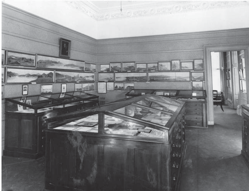
La salle du Régime français à l'intérieur du McCord National Museum, dans la maison Jesse Joseph, vers 1927. (MP-0000.181.1.1)